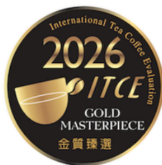
國際茶咖啡品鑑大會 INTERNATIONAL SENSORY EVALUATION OF TEA AND COFFEE IN TAIWAN GOLD MASTERPIECE 2026