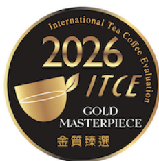
國際茶咖啡品鑑大會 INTERNATIONAL SENSORY EVALUATION OF TEA AND COFFEE IN TAIWAN GOLD MASTERPIECE 2026