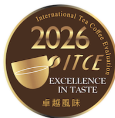
國際茶咖啡品鑑大會 INTERNATIONAL SENSORY EVALUATION OF TEA AND COFFEE IN TAIWAN EXCELLENCE IN TASTE 2026